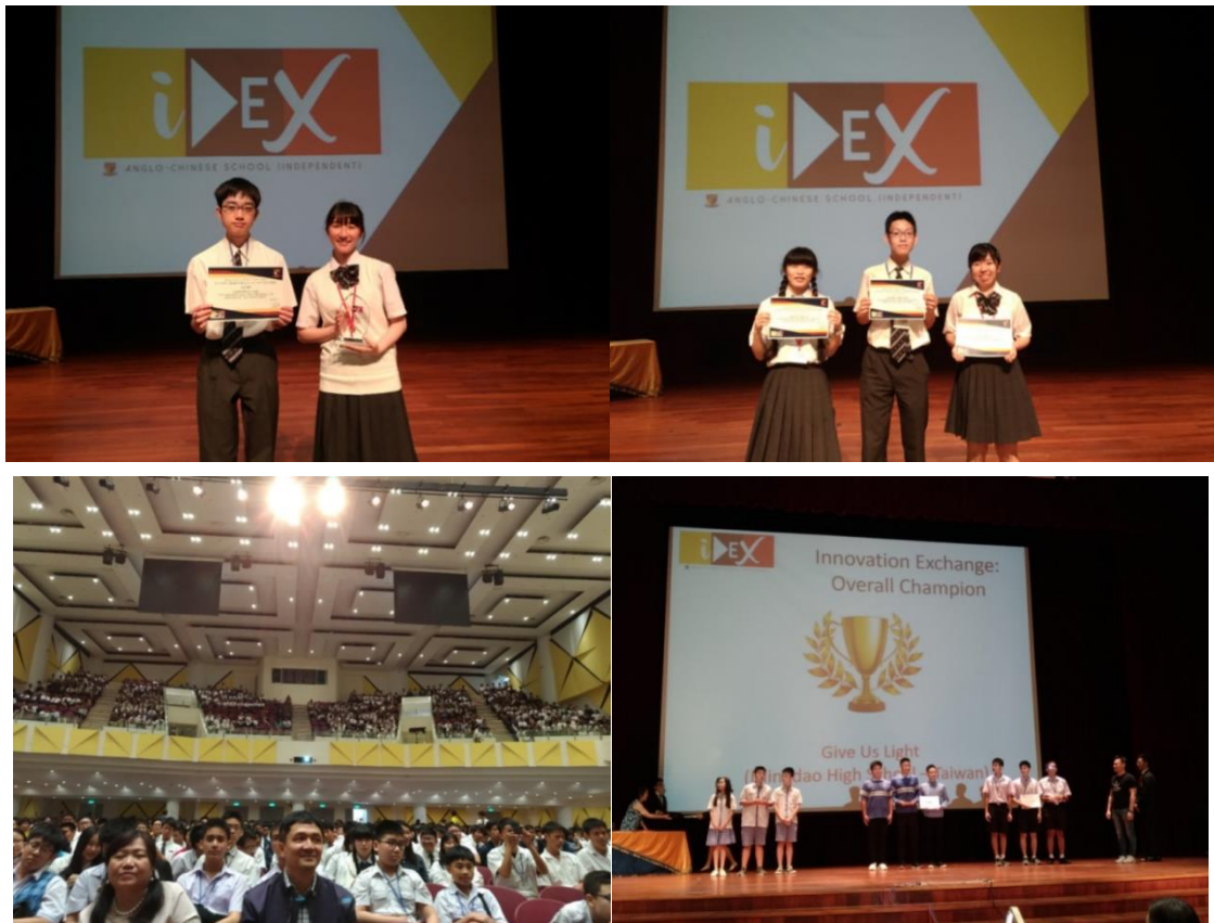
表彰の様子 Award Ceremony