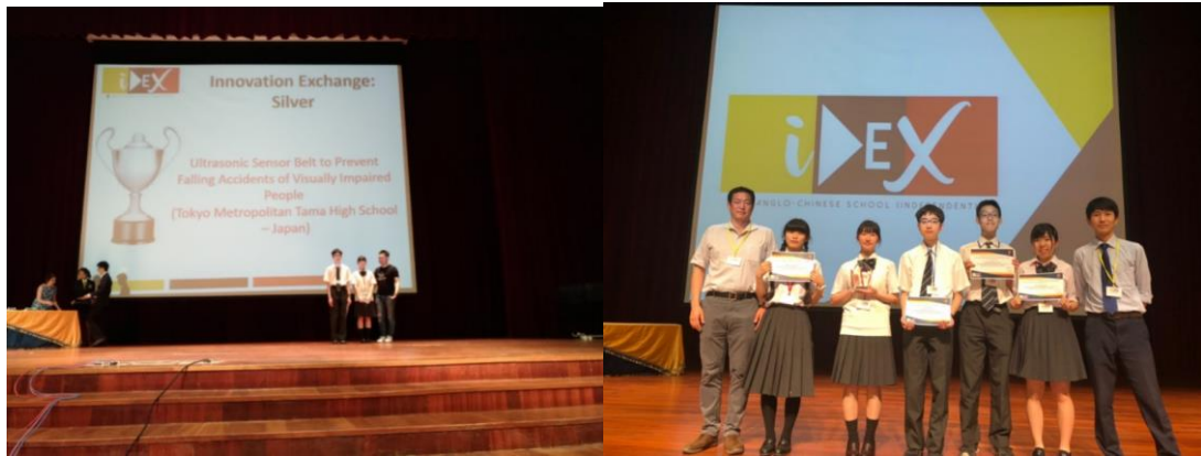
表彰の様子 Award Ceremony