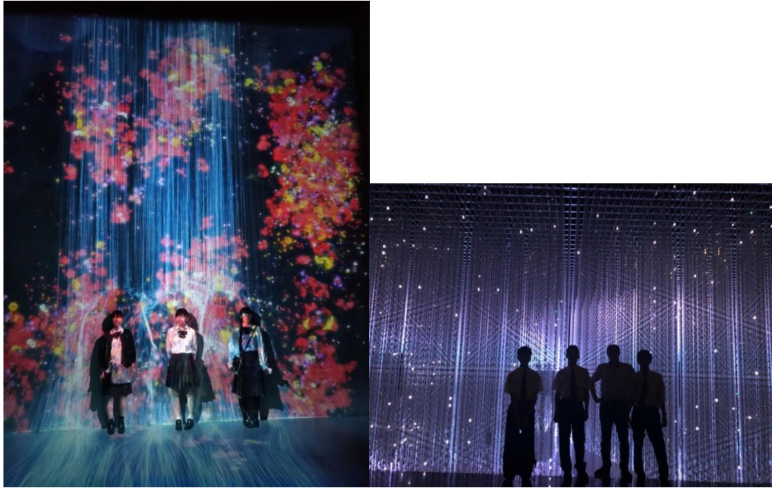
フューチャーワールドにて Future World