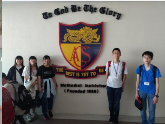
アングロチャイニーズインディペンデントにて Anglo-Chinese School (Independent)