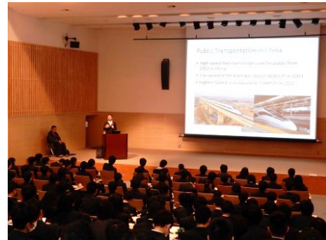
「日産の自動走行システム開発の取り組み」