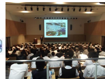
本校サイエンスホールでの講演