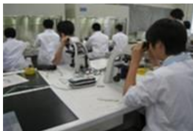
充実した実験・実習