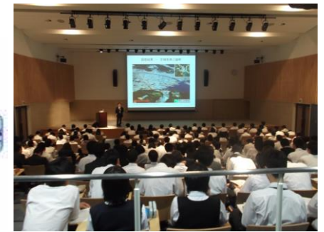
本校サイエンスホールでの講演